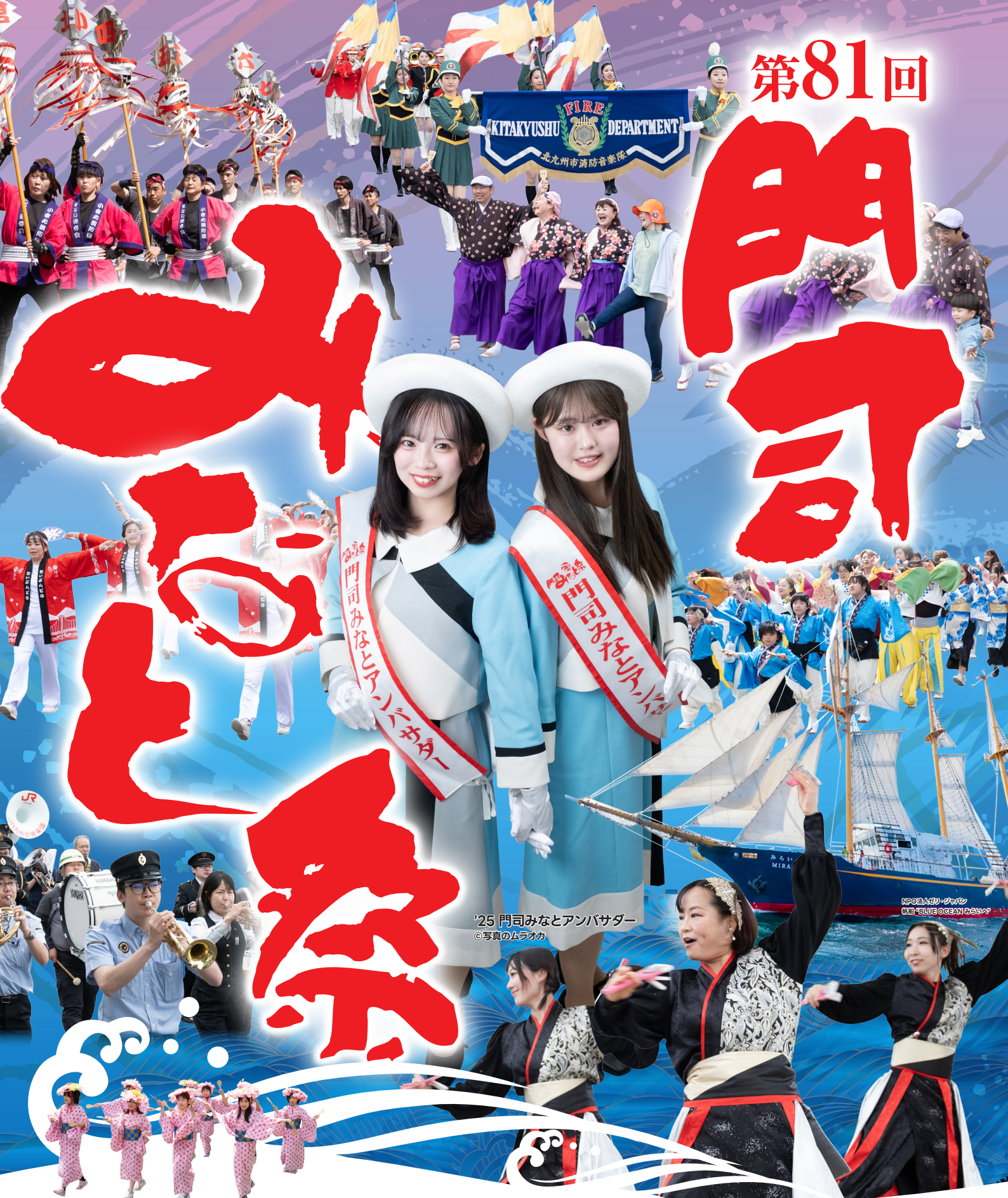
'25 門司みなとアンバサダー ◎写真のムラカミ