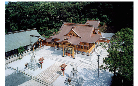
戸上神社 門司区大里戸ノ上四丁目4番2号