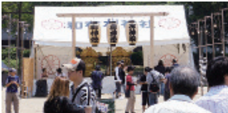
和布刈神社 門司区大字門司 3492